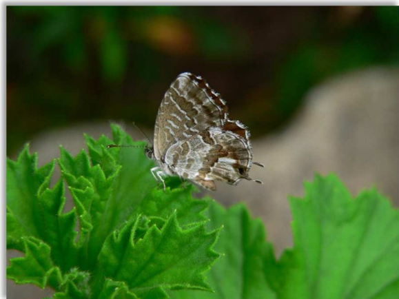
Simpson D., 2011