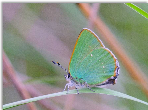
Soulet D., 2015