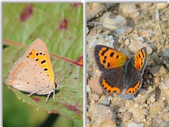
Soulet D., 2009