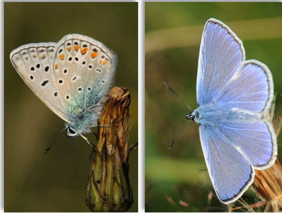
Soulet D., 2011