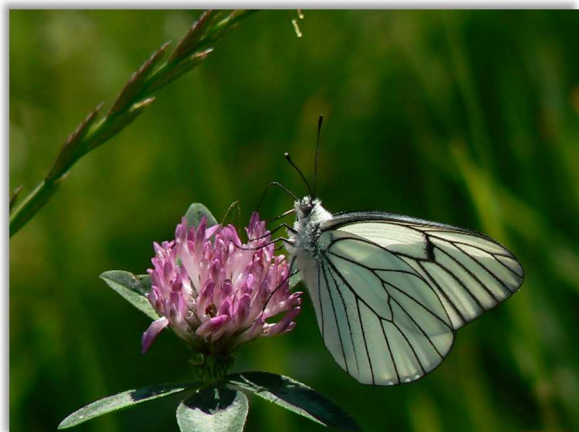
Gourvil P-Y., 2007