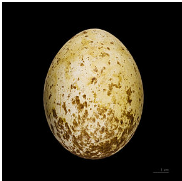
Œuf - Muséum de Toulouse