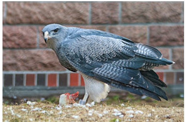
Geranoaetus melanoleucus au zoo de Berlin