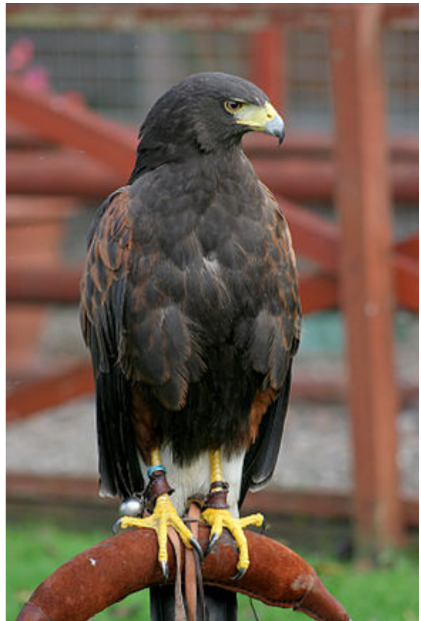
Buse de Harris