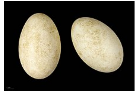
Anser canagicus - MHNT