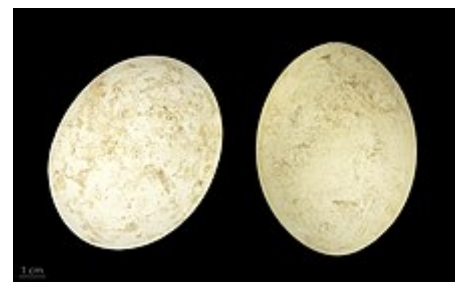
Anseranas semipalmata - MHNT

La photo montre bien les longues pattes, les doigts semi-palmés, et le bec crochu et caronculé rappelant celui du vautour