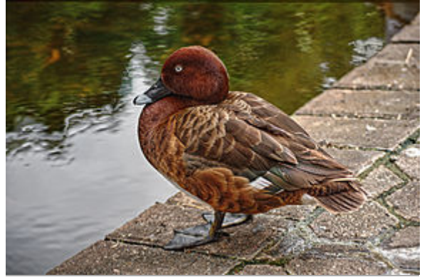
Aythya australis mâle