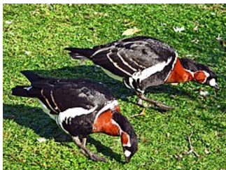
Couple de bernaches à cou roux.