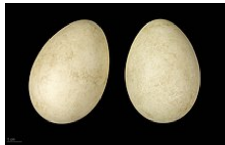
Branta ruficollis .

Par grand froid, elles se serrent les unes contre les autres en un groupe qui peut atteindre plusieurs milliers d'individus qui se tiennent chaud, comme le font les manchots de l'Antarctique. Les nuits d'hiver, elles se reposent sur le lac (plusieurs milliers, accompagnées la nuit de milliers d'Oies rieuses. Parfois, les oies rieuses et les bernaches mangent ensemble sur les aires de gagnage.