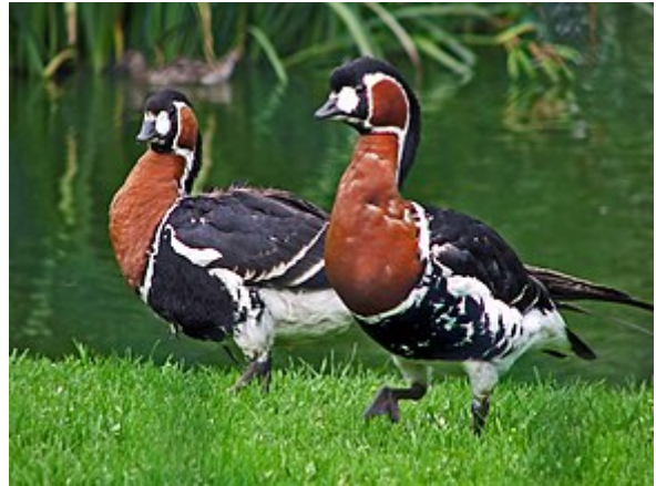
Bernache à cou roux