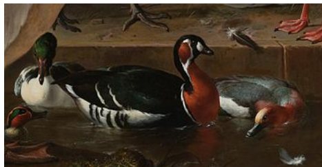
Melchior d'Hondecoeter (1636-1695) détail (bernache à cou roux) de son tableau Un Pélican et autres volailles (1680).