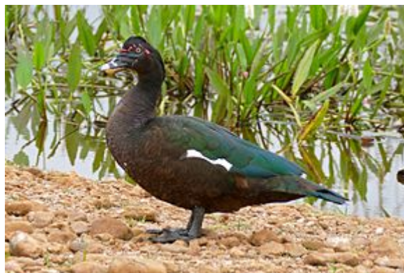
Cairina moschata ♂ (Mato Grosso, Brésil )