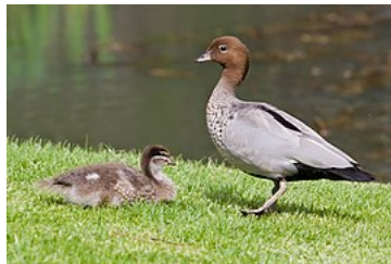
aux jardins botaniques de Melbourne