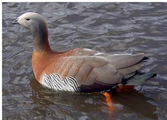
Ochette à tête grise dans un parc animalier