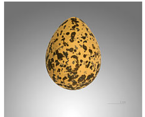
Œuf de vanneau à éperons – Muséum de Toulouse