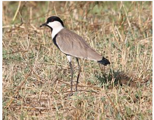
Vanneau à éperons