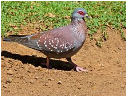
Pigeon roussard ( Ptilinopus )

C'est un grand pigeon, d'une longueur de 41 cm. Son dos et ailes sont rousses, et ces dernières fortement tachetées de blanc. Le reste des parties supérieures et inférieures sont bleu-gris, et la tête est grise avec des zones rouges autour de l'œil. Le cou est brunâtre, strié de blanc, et les pattes rouges.