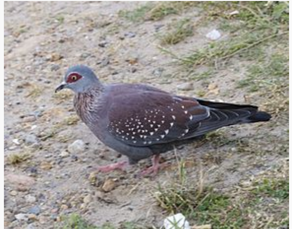
Columba guinea phaeonota

Cet oiseau est fréquemment observé autour des habitations humaines et des cultures.