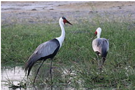
grues caronculées (bande de Caprivi)

Elle fréquente les endroits humides d' Afrique subsaharienne , notamment le miombo , en Éthiopie et l'est de l' Afrique du Sud .