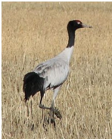
Grue à cou noir dans le Parc national du Pota tso au Yunnan

Grâce à son sternum en boîte creuse, elle fait résonner son chant haut perché, même en vol.