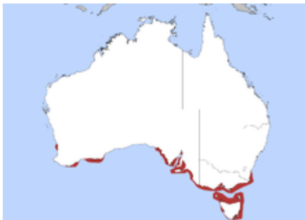
Zones de répartition (en rouge) de l'espèce.

On le trouve sur toutes les côtes du Sud de l'Australie depuis le cap Leeuwin en Australie occidentale jusqu'à l'État de Victoria . On le trouve aussi sur les côtes de Tasmanie et les îles du détroit de Bass À la différence des autres cormorans australiens, on ne le trouve pas à l'intérieur des terres mais uniquement sur les côtes et en mer.