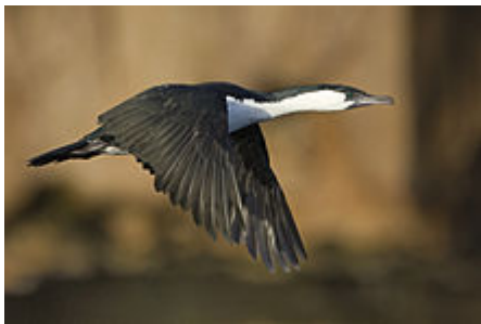
Cormoran de Tasmanie en vol

Il mesure 65 cm de long. Les parties supérieures sont noires et les inférieures blanches.