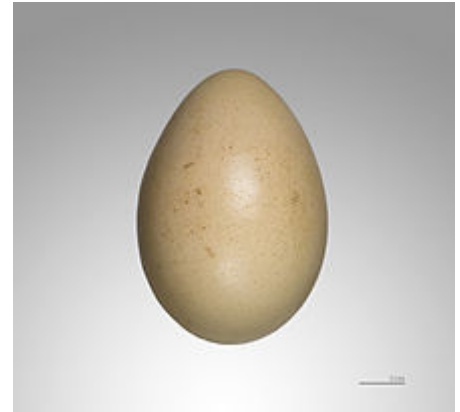
Œuf de Faisan argenté - Muséum de Toulouse

Le faisán argenté habite surtout les versants enherbés et buissonneux parsemés de pitons rocheux en lisière de forêt. Il pénètre aussi dans les clairières et les bois clairs mais évite généralement la forêt dense.