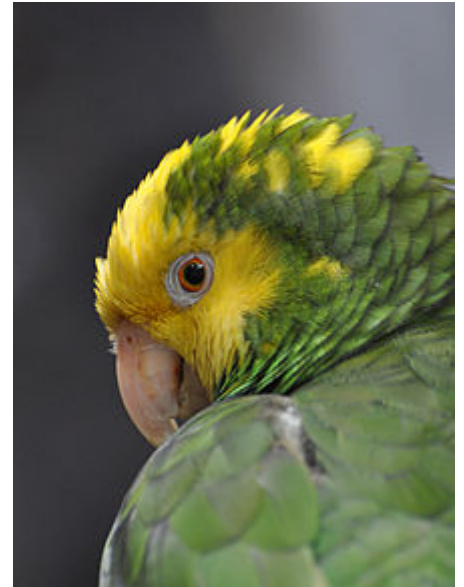
Un Amazona oratrix

Elle atteint sa maturité sexuelle entre 4 et 6 ans. L'Amazone vit en couple, et pond généralement entre 3 et 5 œufs qu'elle couve 29 jours. Les petits quittent le nid au bout de 70 jours.