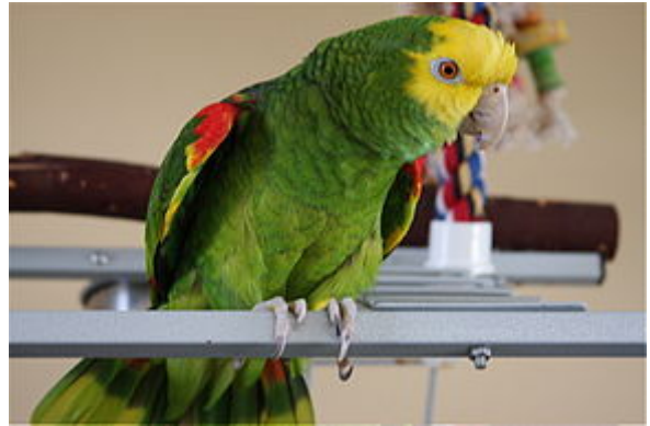
Amazone à tête jaune