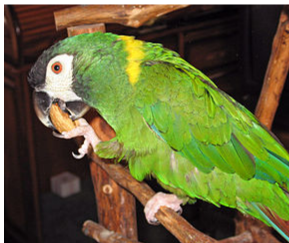
Un ara à collier jaune en captivité.