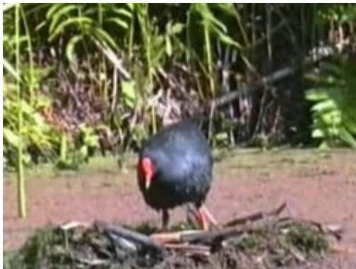
Lire le média

Sherwood Arboretum, SE Queensland, Australia