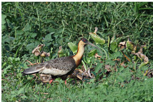
Ibis mandore, Pantanal, Brésil