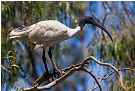
Ibis à cou noir sur une branche d'arbre.