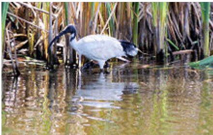
Ibis à cou noir dans un marais de Bunbury, Australie de l'Ouest (Australie).

Il est répandu dans tout le Nord et l'Est de l'Australie et au Sud-Ouest de l'Australie. On ne le trouve pas en Tasmanie . Il vit dans toutes les régions qui ne sont pas désertiques. Il vit dans les marais, les prairies et à