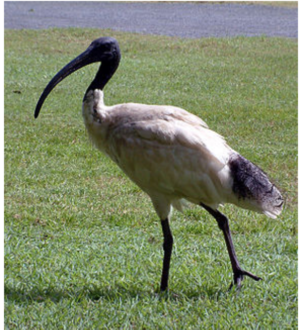
Ibis à cou noir