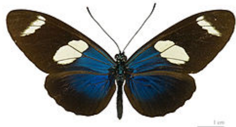
heliconius sara sara - MHNT