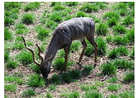
Petit koudou mâle