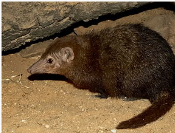
Mangouste brune photographiée au zoo de Plzeň (Tchéquie)