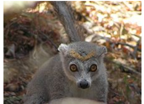
Lémur couronné femelle