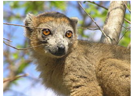
Lémur couronné mâle