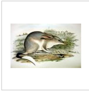
Un bilby (dessin de John Gould , 1863).