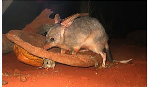
Un bilby (sous l'assiette se trouve un Notomys alexis .)