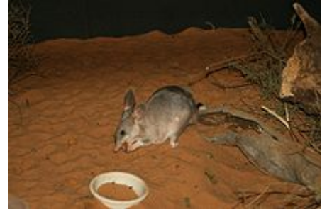
Bilby en train de manger

Le bilby est omnivore, il se nourrit de graines (notamment des espèces d'herbes Dactyloctenium radulans et Yakirra australiense ), de bulbes ( Cyperus bulbosus 4 ), de larves, de termites, de fourmis, d'araignées, de fruits, de champignons, de lézards et occasionnellement d'œufs, d'escargots et de petits mammifères. Il ne boit pas, l'eau contenue dans les aliments qu'il consomme suffit à ses besoins 3 .