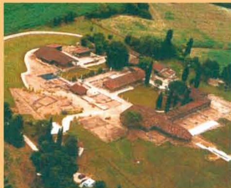
La villa gallo-romaine de Séviac est ouverte de mars à novembre. Renseignements auprès de la Mairie ou de l'Office de Tourisme.

Avec ses thermes, ses mosaïques, ses dimensions exceptionnelles, la villa permet de comprendre la vie dans une riche demeure à l'époque gallo-romaine. Avec ses vestiges mérovingiens, le site évoque les débuts de l'ère chrétienne.